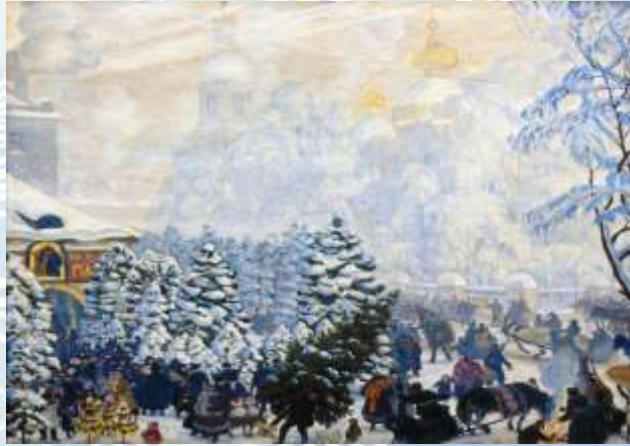
Борис Кустодиев. Ёлочный торг.

Скоро наступит Новый год. Каждый из нас по-своему любит этот праздник. Вкус мандаринов, аромат елки, пушистый снежок, ожидание чуда... Новогодняя суета и приятные хлопоты, предвкушение каникул и посиделок с друзьями... Просмотр любимых рождественских и новогодних фильмов и мультиков. А долгие зимние вечера просто созданы для того, чтобы забраться в кресло с пледом и чаем и погрузиться в чтение любимой книги.