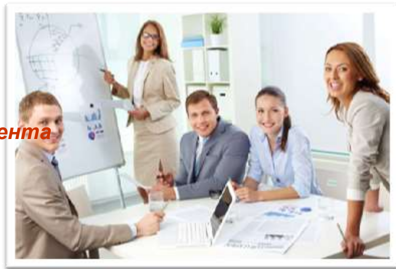
ФОТО-КОНКУРС «ФИНАНСЫ В НАШЕЙ ЖИЗНИ»

- «Путеводитель по основам финансовой грамотности» и т.п.