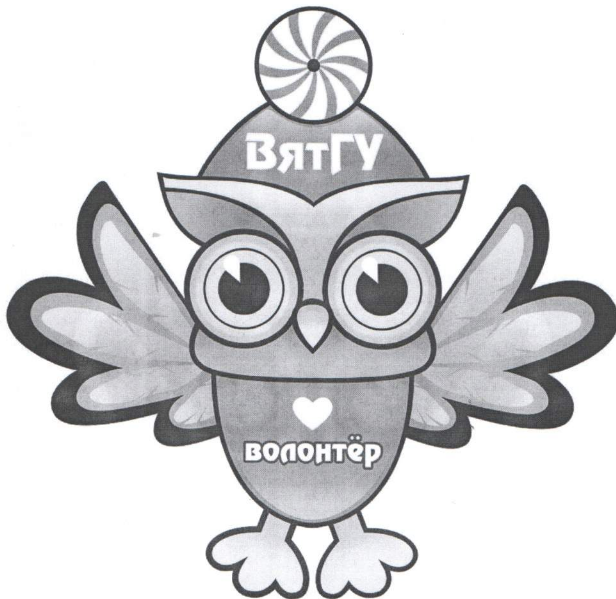
Рисунок 1 – логотип Волонтерского центра ВятГУ