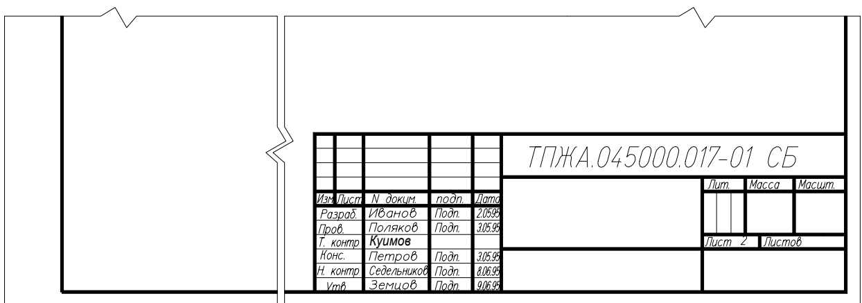
Рисунок А.10 - Примеры заполнения основной надписи и размеры рамки на листе графической части дипломного проекта (дипломной работы): а – первый лист чертежа или схемы, б – второй лист этого же чертежа