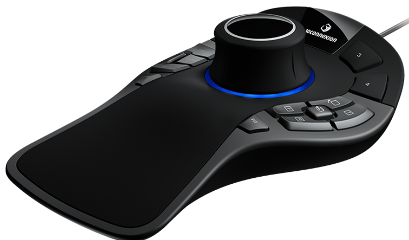
3D-манипулятор SpaceMouse Pro