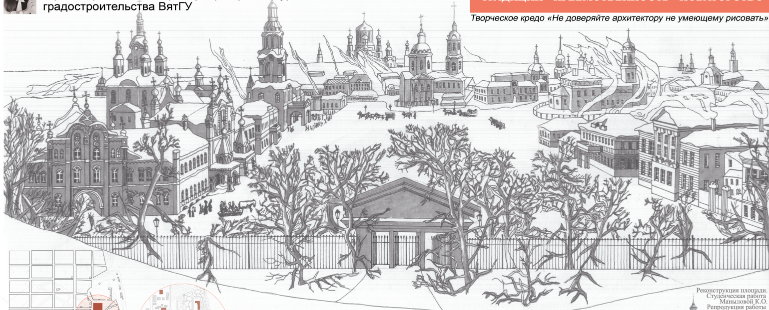
Реконструкция площади. Студенческая работа Маныловой К.О. Репродукция работы Силизиева А.Н.

Творческое кредо «Не доверяйте архитектуру не умеющему рисовать»