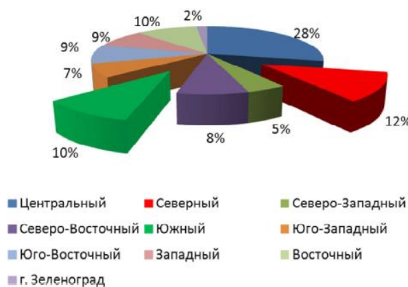
Численность рабочих (тыс. чел.)

3. К этой же таблице добавьте еще одну объемную круговую диаграмму с подписями данных: