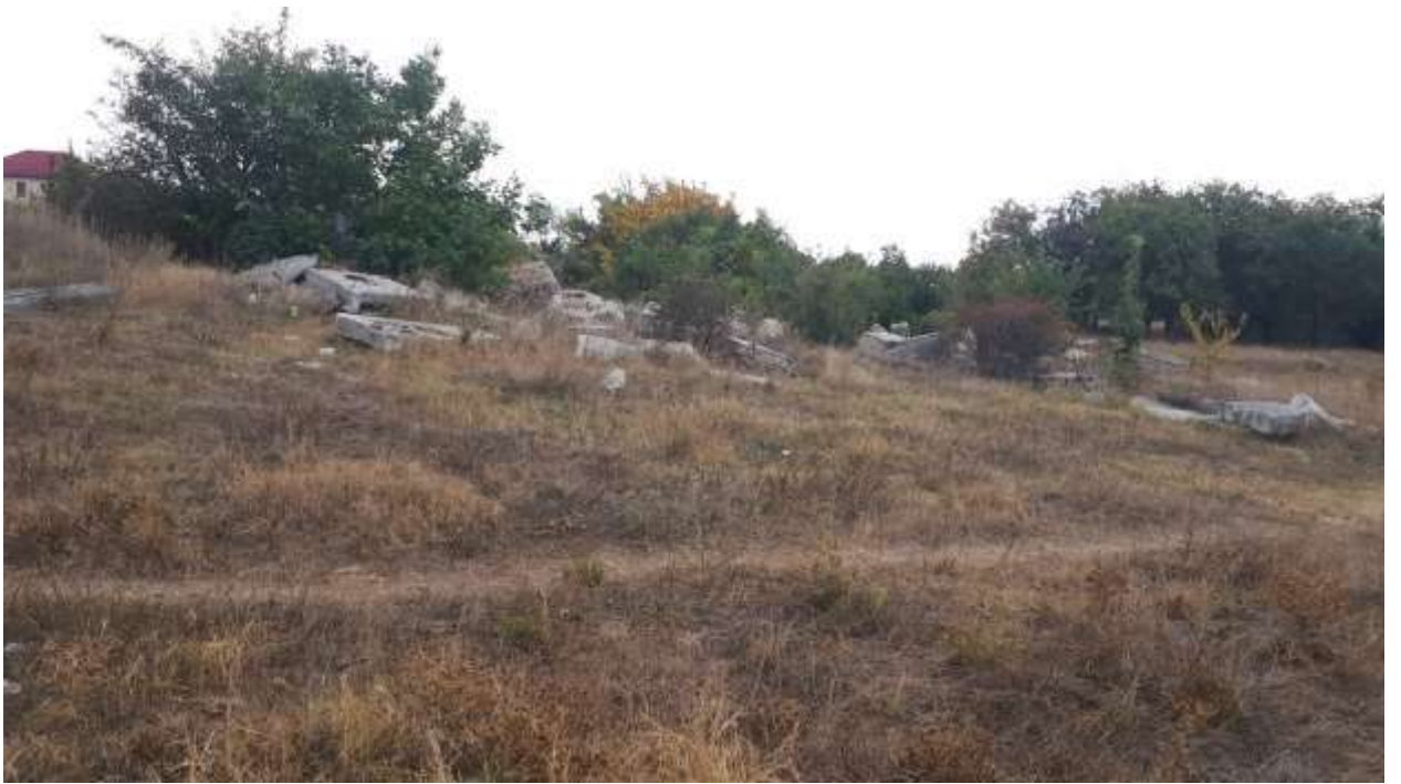
Развалины старой школы - Дубки