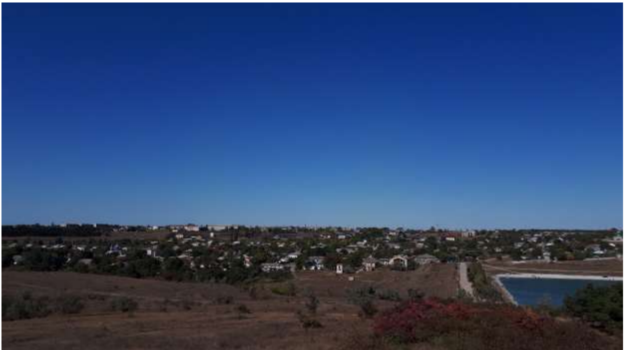
Панорама – Кольчугино (Кроненталь)