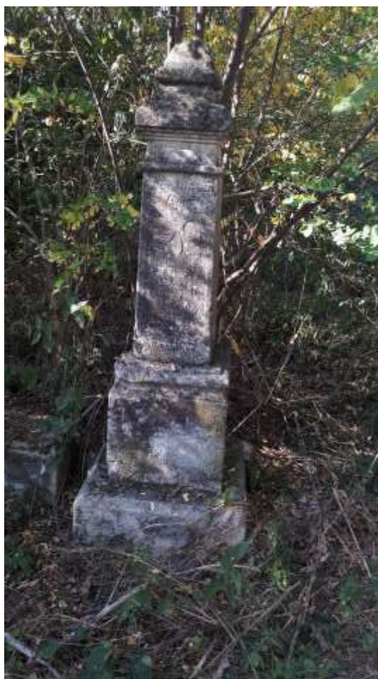
Старые немецкие надгробия – кладбище п. Курортное (Фриденталь)