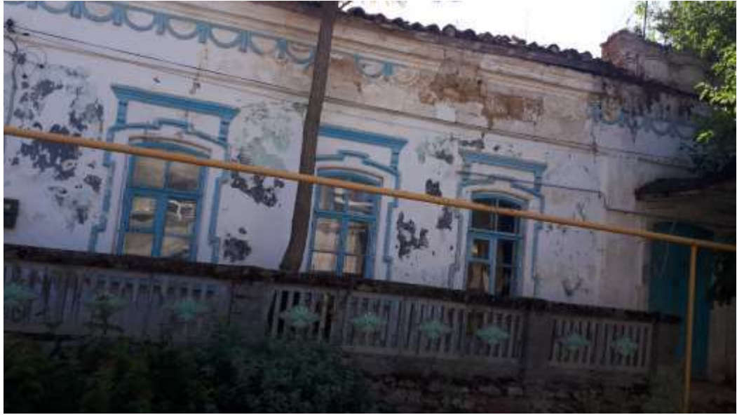
Дом бывшего немецкого управляющего – Кольчугино (Кроненталь)