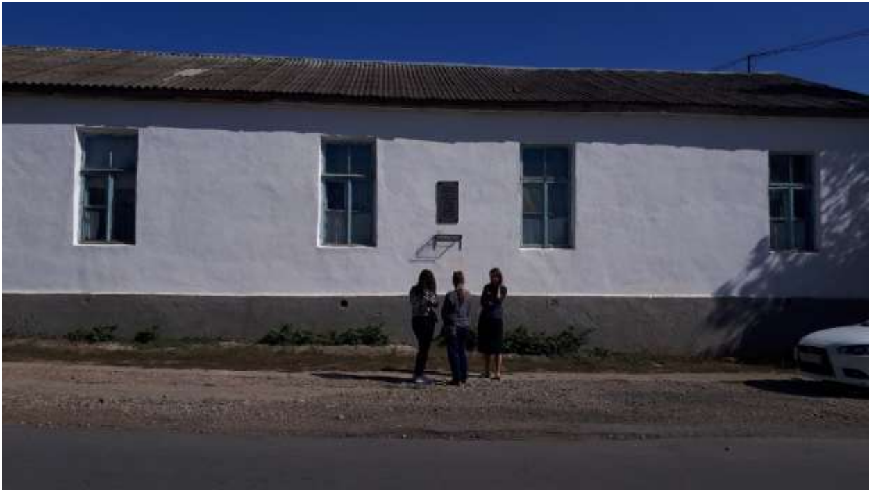
Больница – Кольчугино (Кроненталь)