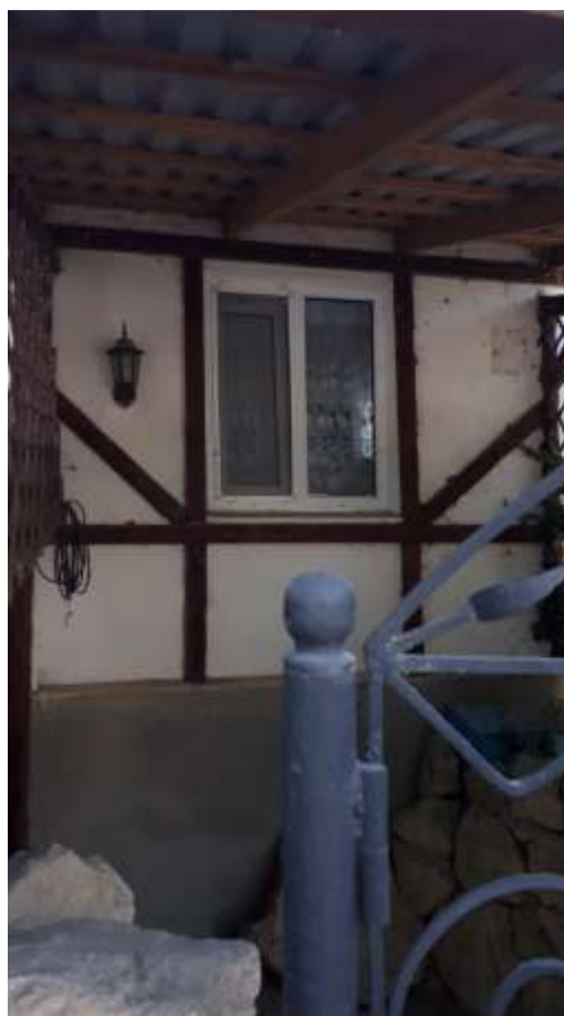
Дом бывшего управляющего поселения Шнайдера – Кольчугино (Кроненталь)