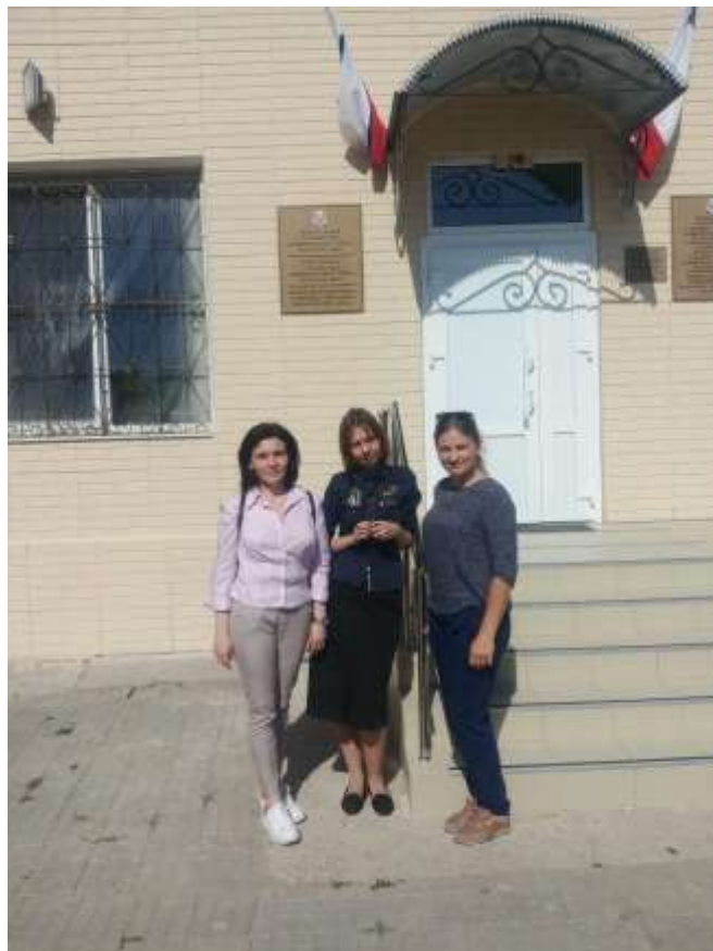
Сельсовет – Кольчугино (Кроненталь)