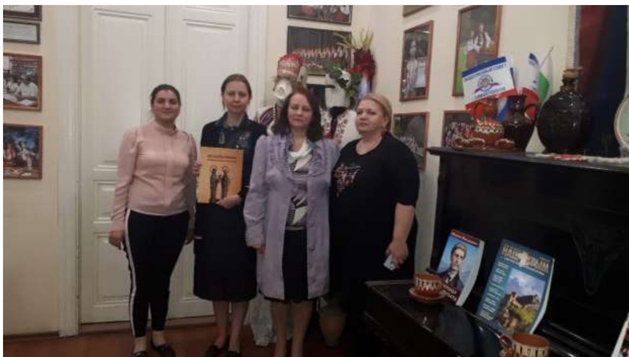
Центр болгарской культуры им. Ивана Вазова