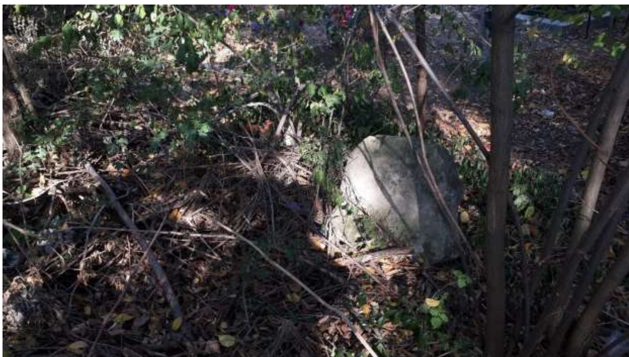
Старые немецкие надгробия – кладбище п. Курортное (Фриденталь)