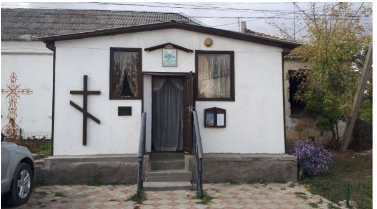
Церковь Блаженной Ксении – Дубки