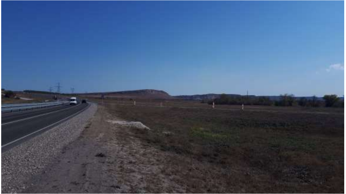
По дороге в поселения Розенталь и Фриденталь – Крым