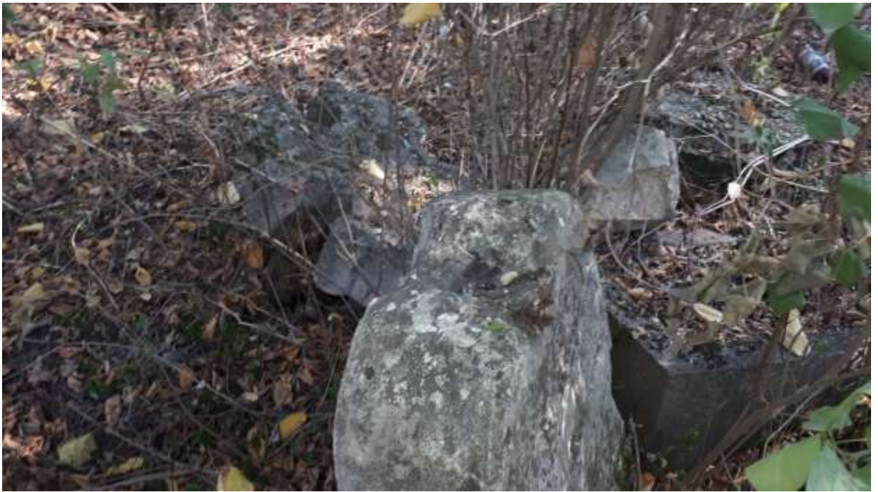
Старые немецкие надгробия – кладбище п. Курортное (Фриденталь)