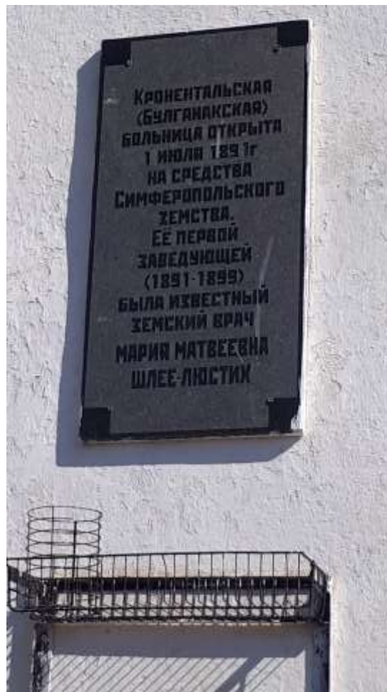
Вывеска на больнице – Кольчугино (Кроненталь)