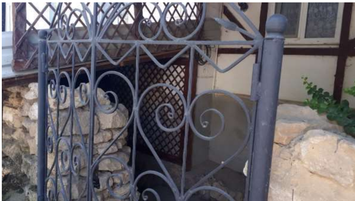
Дом бывшего управляющего поселения Шнайдера (вход в подвал) – Кольчугино (Кроненталь)