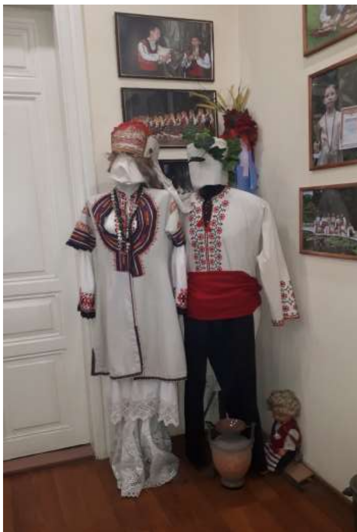
Национальные костюмы (Центр болгарской культуры им. Ивана Вазова г. Симферополь, Крым)