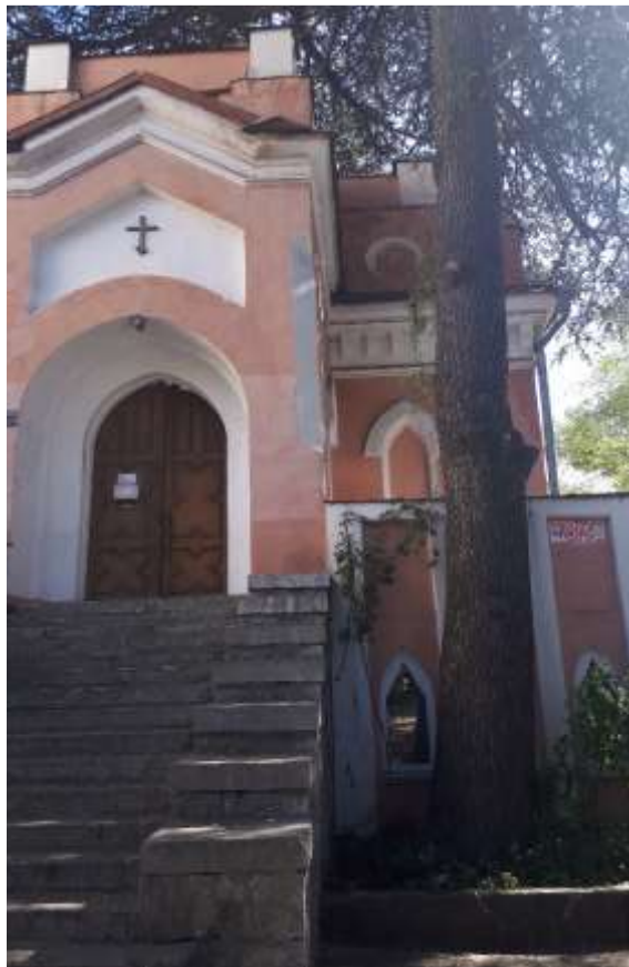
Кирха – г. Ялта