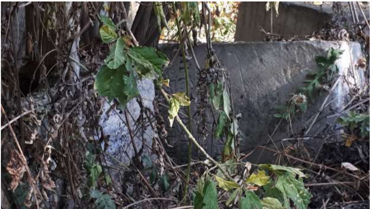
Старые немецкие надгробия – кладбище п. Курортное (Фриденталь)