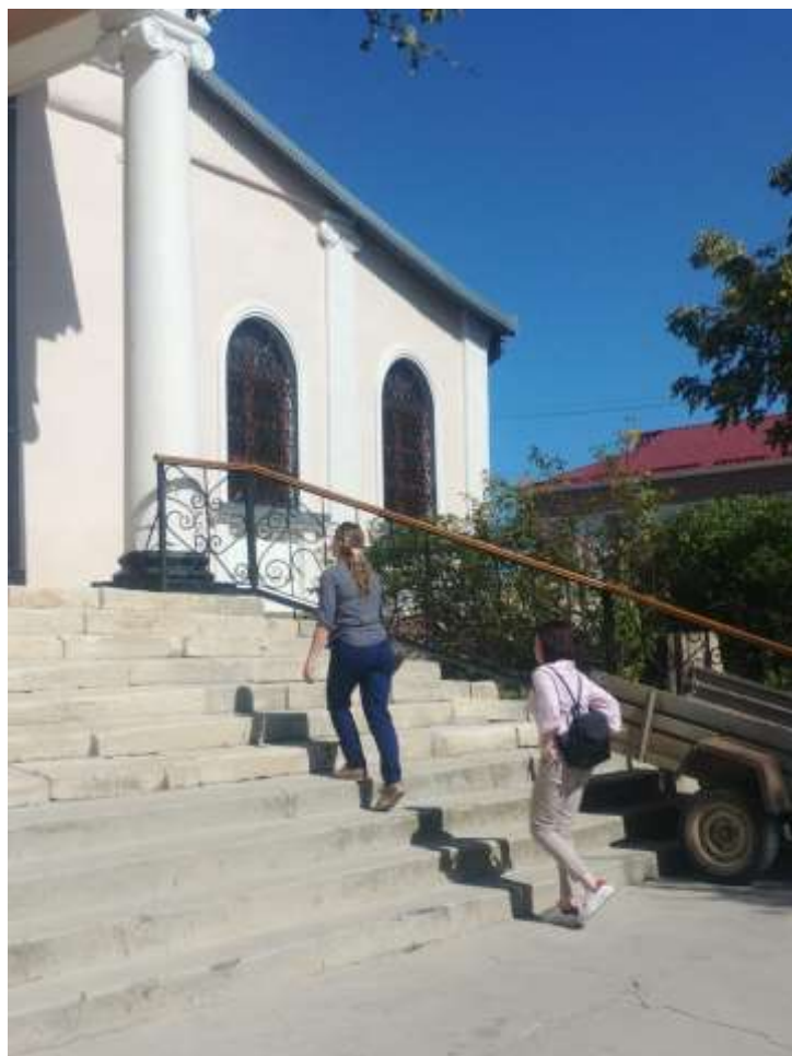
Кирха – Кольчугино (Кроненталь)