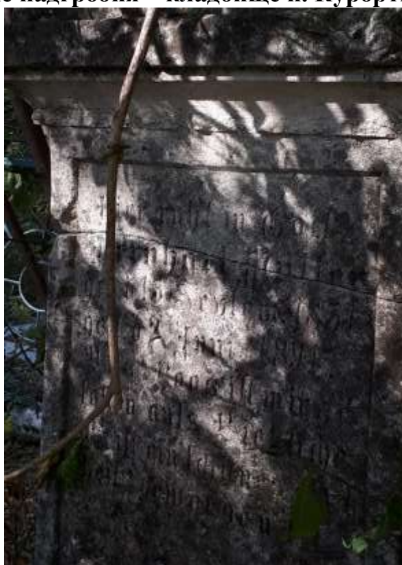
Старые немецкие надгробия – кладбище п. Курортное (Фриденталь)