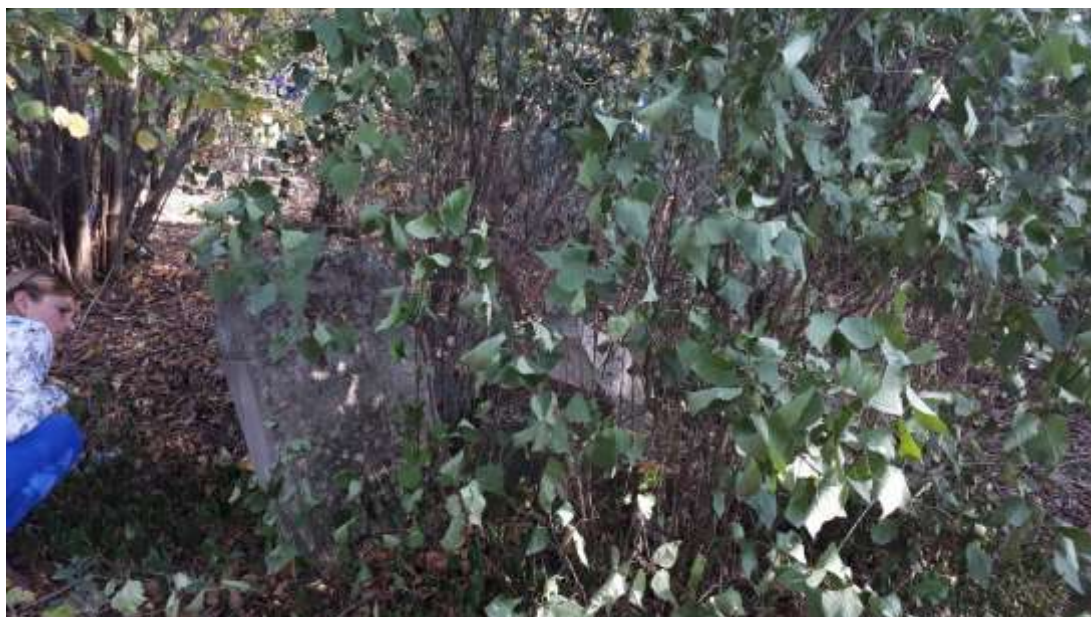
Старые немецкие надгробия – кладбище п. Курортное (Фриденталь)