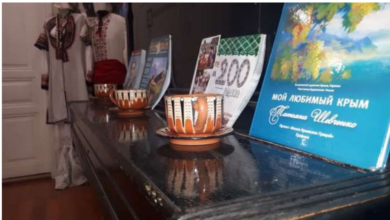
Выставочные экспонаты – изделия народного промысла (Центр болгарской культуры им. Ивана Вазова г. Симферополь, Крым)