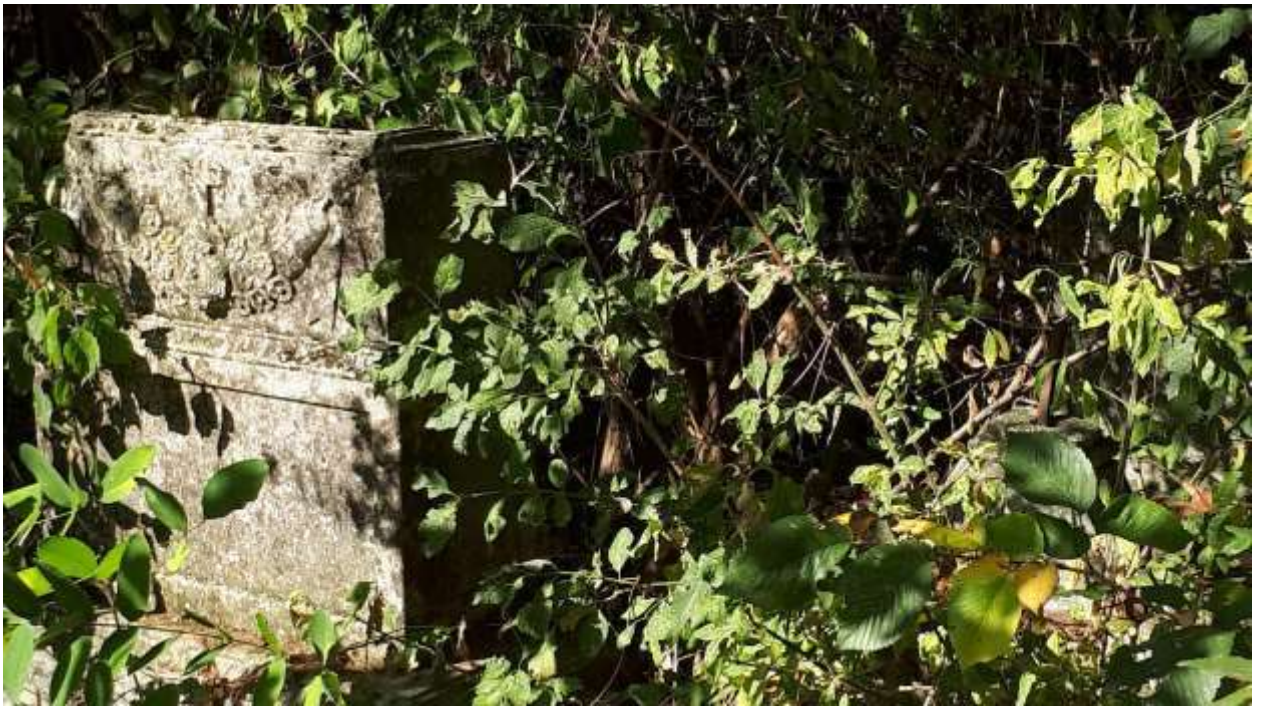
Старые немецкие надгробия – кладбище п. Курортное (Фриденталь)