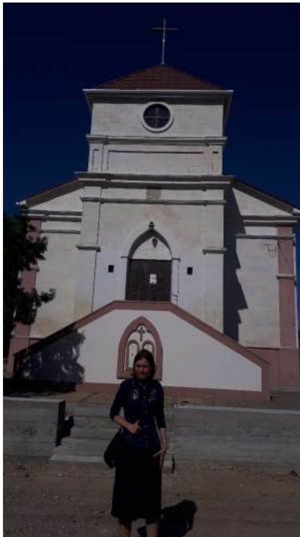
Кирха – Кольчугино (Кроненталь)