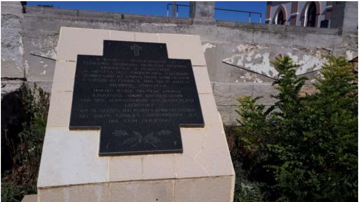
Памятный камень – Кольчугино (Кроненталь)