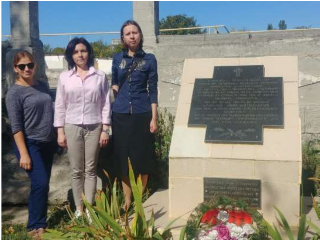
Памятный камень – Кольчугино (Кроненталь)