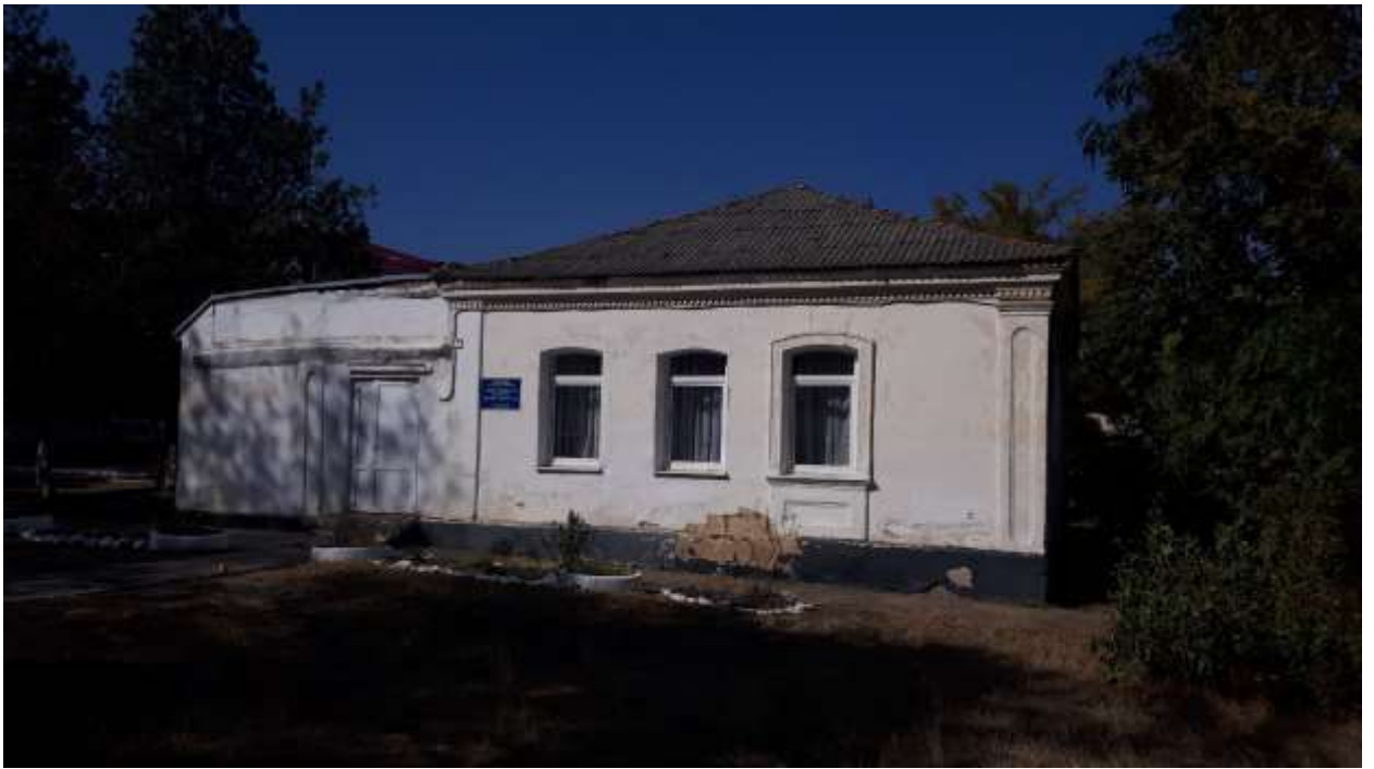
Здание музыкальной школы – Ароматное (Розенталь)