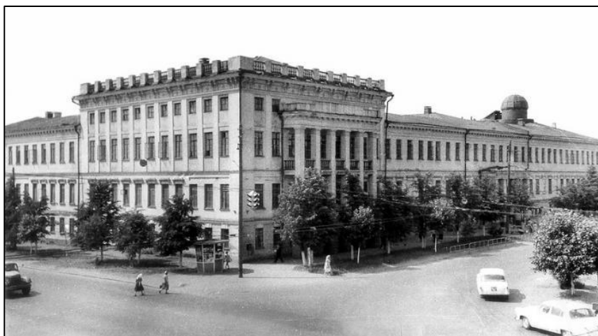
Здание педагогического института им. В.И. Ленина. В период с 1934 по 1937 гг. появился 3 этаж.