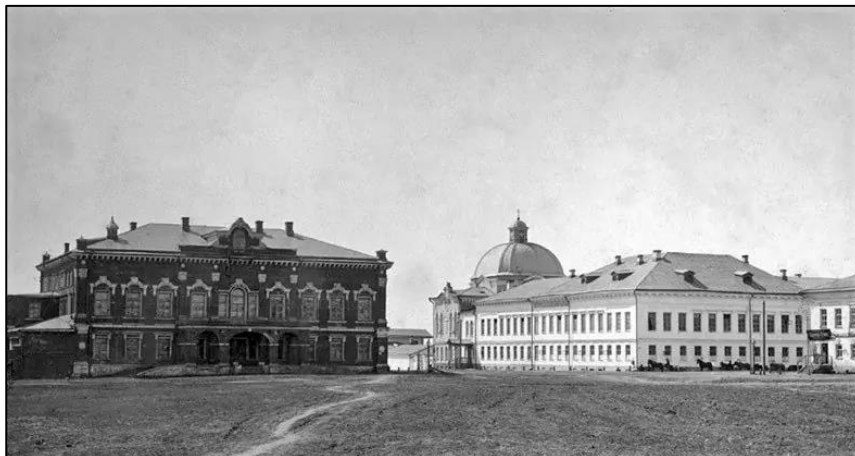
Здание женского епархиального училища. Вятка, ул. Николаевская, ныне Киров, ул. Ленина 111.