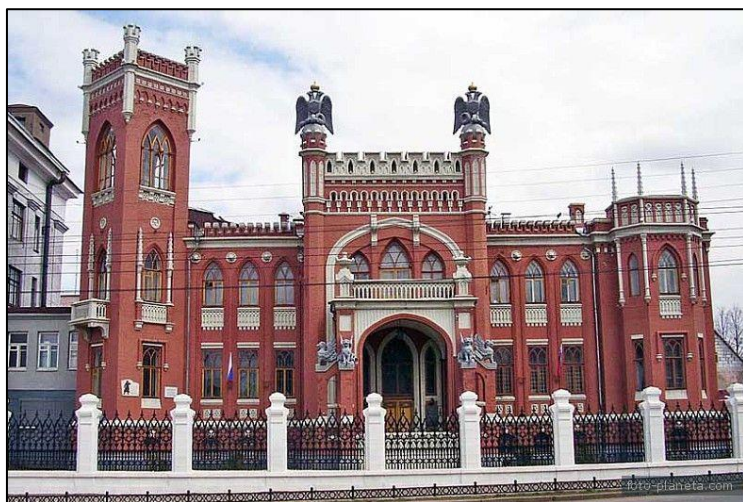
Современный вид. Киров, ул. Ленина 96А Ныне здание Управления ФСБ России по Кировской области.

Как уроженец Вятской губернии, Иван Чарушин был прекрасно знаком с особенностями местных условий и в соответствии с ними реализовывал свои архитектурные замыслы.