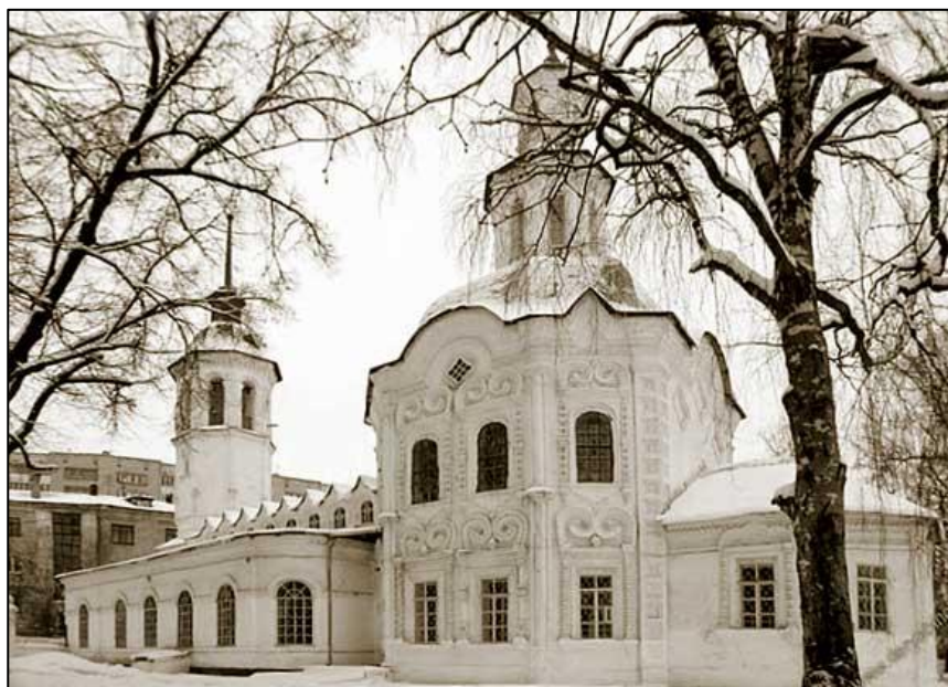
Храм Иоанна Предтечи Киров, улица Свободы, 54Д.