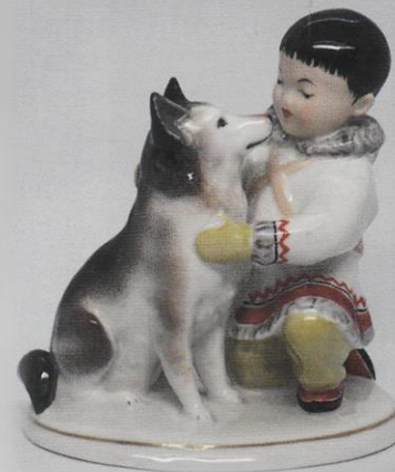
Мальчик-якут с собакой (Дружба). С. Б. Велихова. ЛФЗ.