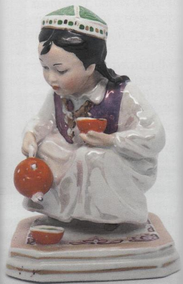
Узбечка с чайником (Маленькая хозяйка). О. М. Богданова. Дулевский фарфоровый завод.