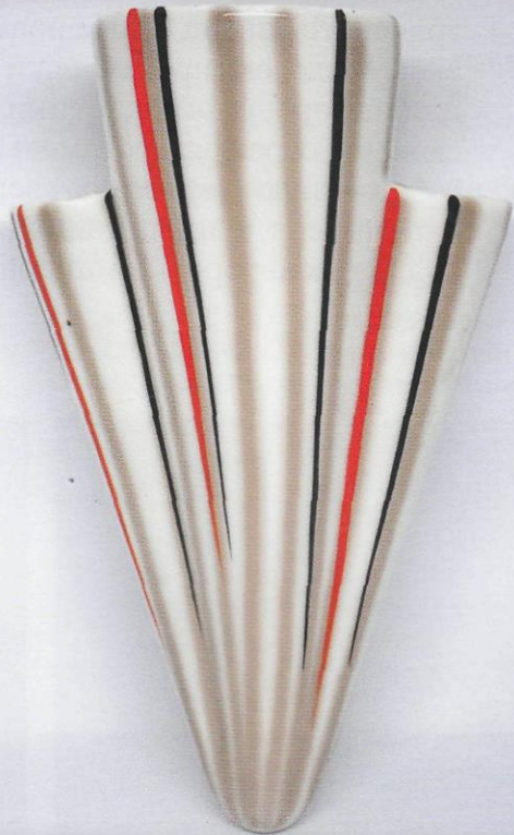
Кашпо «Линии». ЛЗФИ.