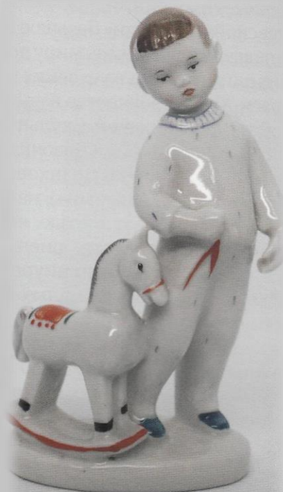
Мальчик с лошадкой Г. С. Соболева. ЛФЗ.