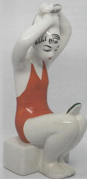
Девушка с зеркалом. Т. А. Федорова. ЛЗФИ.