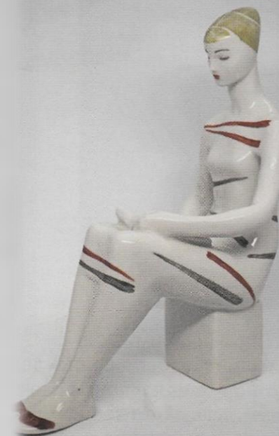
Девушка с книгой. А. А. Киселев. ЛЗФИ.