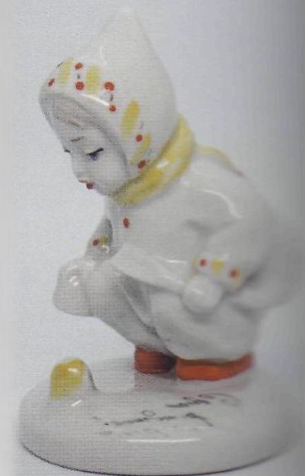
Никитка (Куличики). Т. А. Федорова. ЛЗФИ.