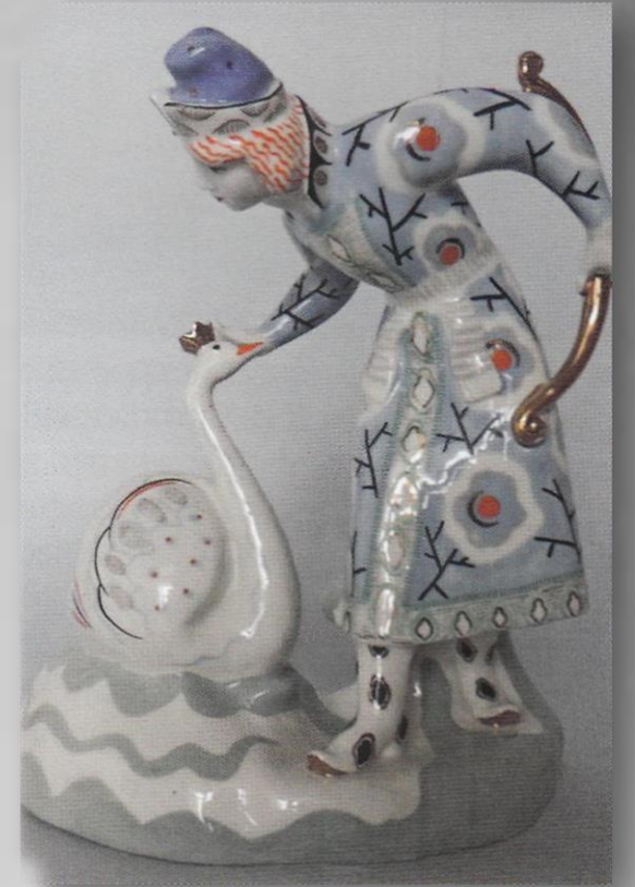
Князь Гвидон и Царевна Лебедь. А. А. Киселев. ЛЗФИ