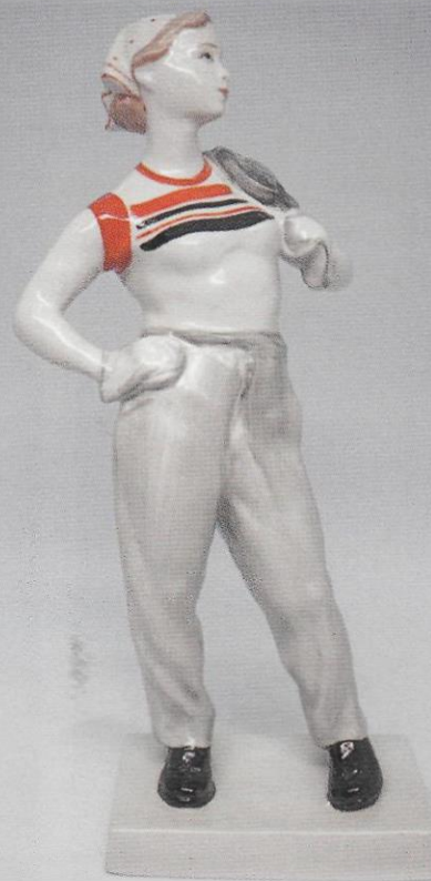
Асфальтоукладчица. А. А. Киселев. ЛЗФИ.