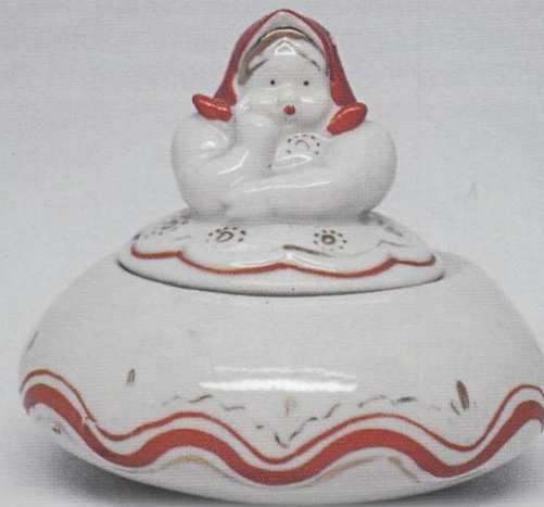
Пудреница «Матрешка». А. В. Дегтярев, Л.Н. Сморгон. ЛЗФИ.