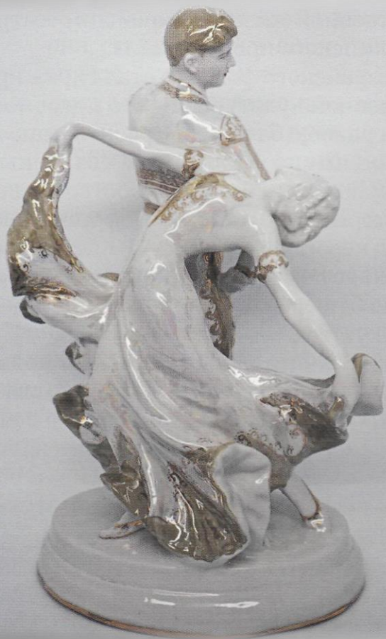
Болеро. В.И. Сычев. ЛЗФИ.