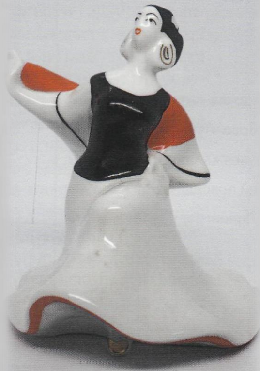
Коррида (Тореадор). Т.А. Федорова. ЛЗФИ.