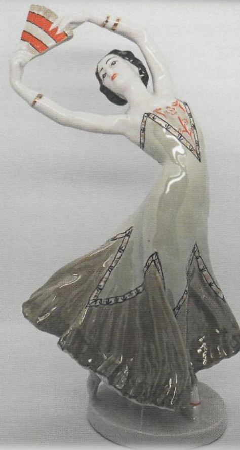
Испанский танец. В.И. Сычев. ЛЗФИ.