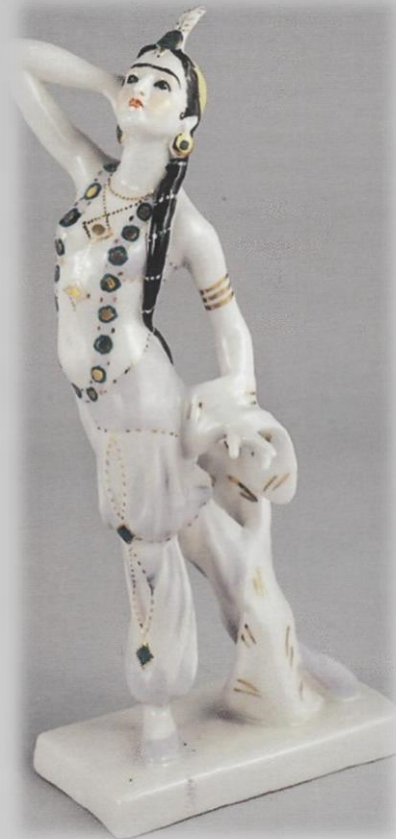
Бахчисарайский фонтан. Зарема. А. А. Киселев. ЛЗФИ.