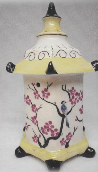
Ночник «Китайский домик». ЛЗФИ.