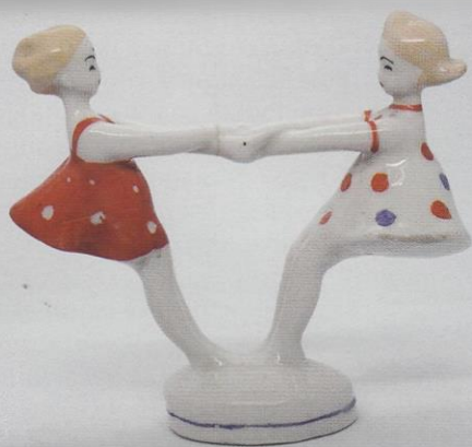
Кружащиеся девочки (Карусель), Т. А. Федорова. ЛЗФИ.