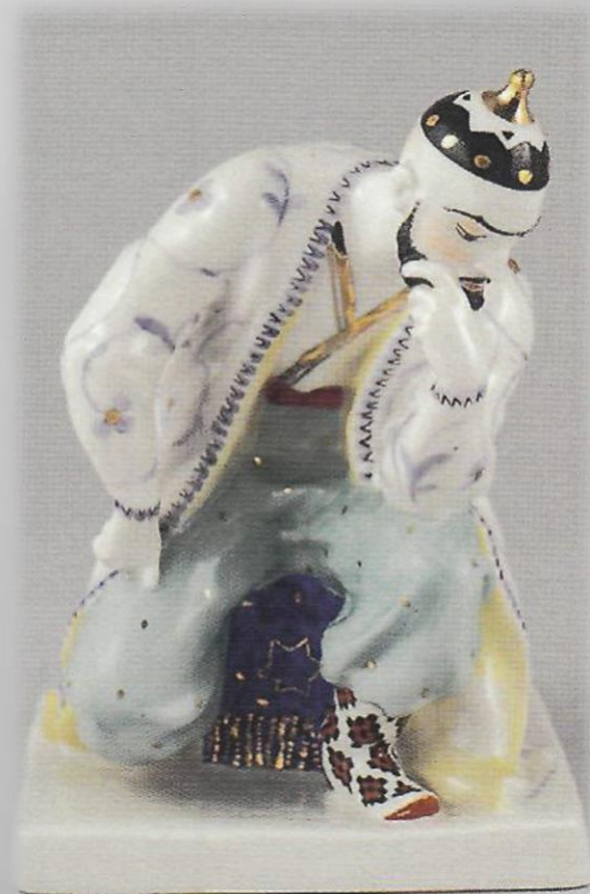
Бахчисарайский фонтан. Хан Гирей. А. А. Киселев. ЛЗФИ.