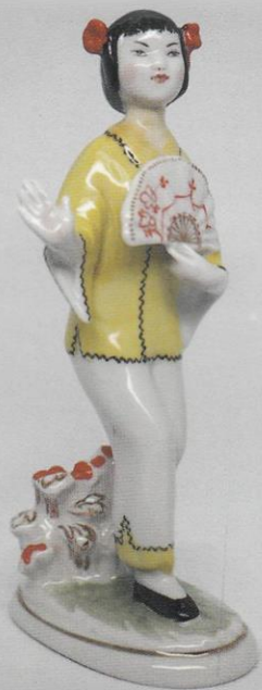
Девочка-китайка с веером. Г.С. Столбова. ЛФЗ.