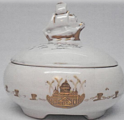
Шкатулка с корабликом «40 лет Октября». А. А. Киселев. ЛЗФИ.