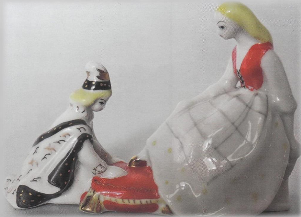
Принц надевающий туфельку Золушке. Т. А. Федорова. ЛЗФИ.