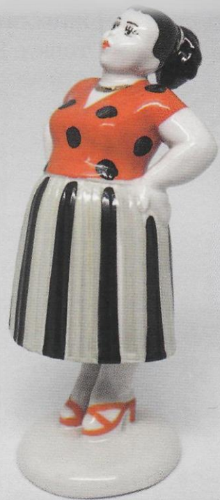
Сплетница (диптих «Разговор») А. В. Дегтярев, Л. Н Сморгон. ЛЗФИ.