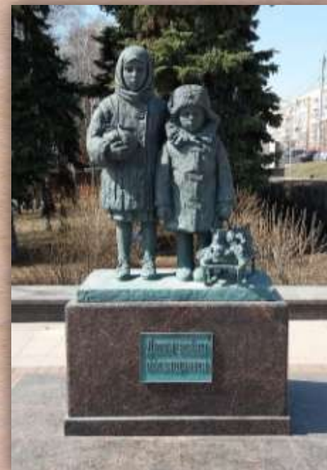
г. Ульяновск, Россия, скульптор М. Галас