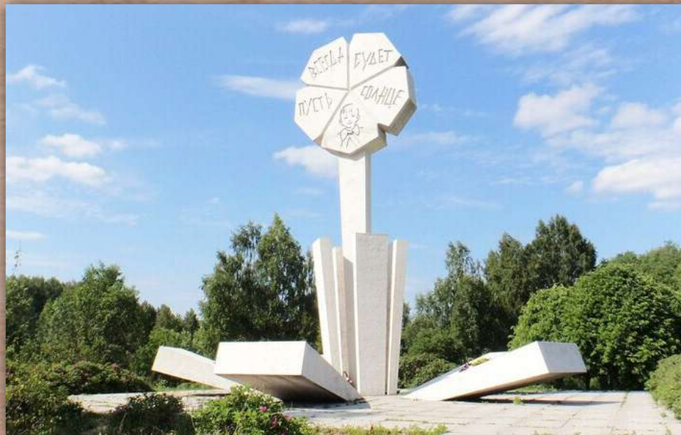
Памятник «Цветок жизни», Всеволожский район, Ленинградская область (3 км «Дороги жизни»), архитектор П. И. Мельников

Щели в саду вырыты, Не горят огни. Питерские сироты, Детоньки мои! Под землей не дышится, Боль сверлит висок, Сквозь бомбежку слышится Детский голосок.