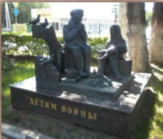
г. Ростов-на-Дону, Россия, скульптор К. Парсамян

Мальчишки-девчонки военной страны! Мы вам до земли поклониться должны: