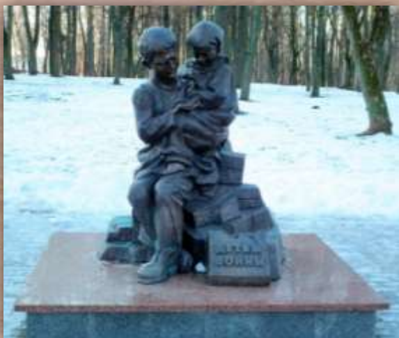
г. Витебск, Беларусь, скульптор В. Могучий