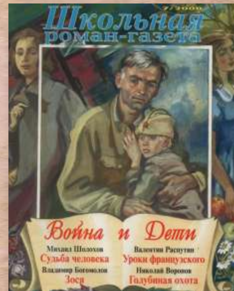
Война и дети : сб. - М. : [б. и.], 2000. - 64 с. - (Школьная роман-газета ; № 7). - Текст : непосредственный. (Шифр: 84(2P)6 / B65)

Бросил машину возле ворот, нового своего сынишку взял на руки, несущу в дом. А он как обвил мою шею ручонками, так и не оторвался до самого места. Прижался своей щекой к моей небритой щеке, как прилип. Так я его и внёс... Вошёл я, моргаю глазами, бодро так говорю: «Вот и нашёл я своего Ванюшку! Принимайте нас, добрые люди!»