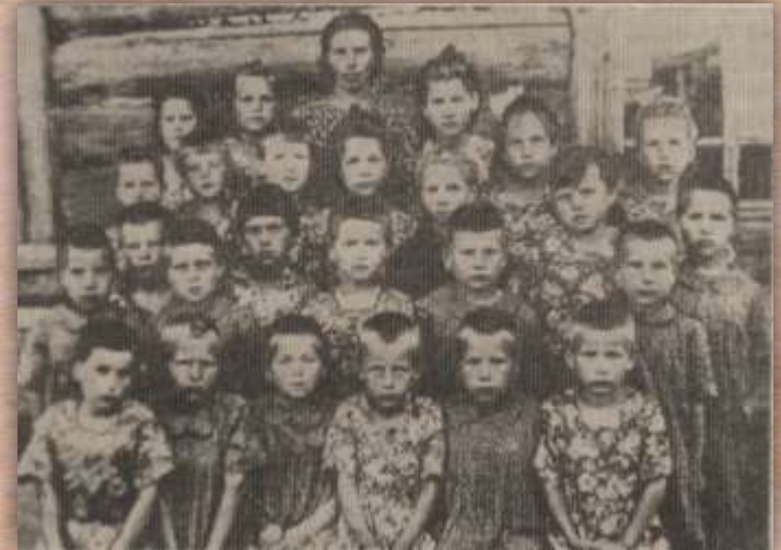
Воспитанники Буяковского детского дома № 10

И пусть мы были маленькими очень, мы тоже победили в той войне. Роберт Рождественский