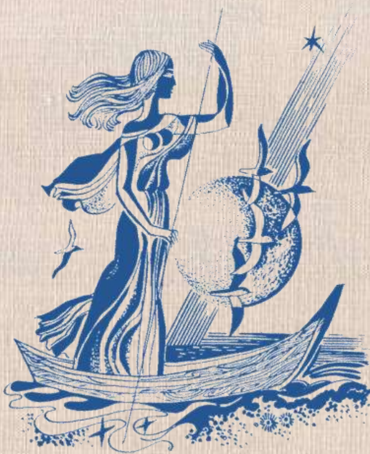
Рисунки Татьяны Дедовой

Стихи мои простят меня – Мне не писалось слишком часто. Признав виновной лишь отчасти, Стихи мои простят меня.